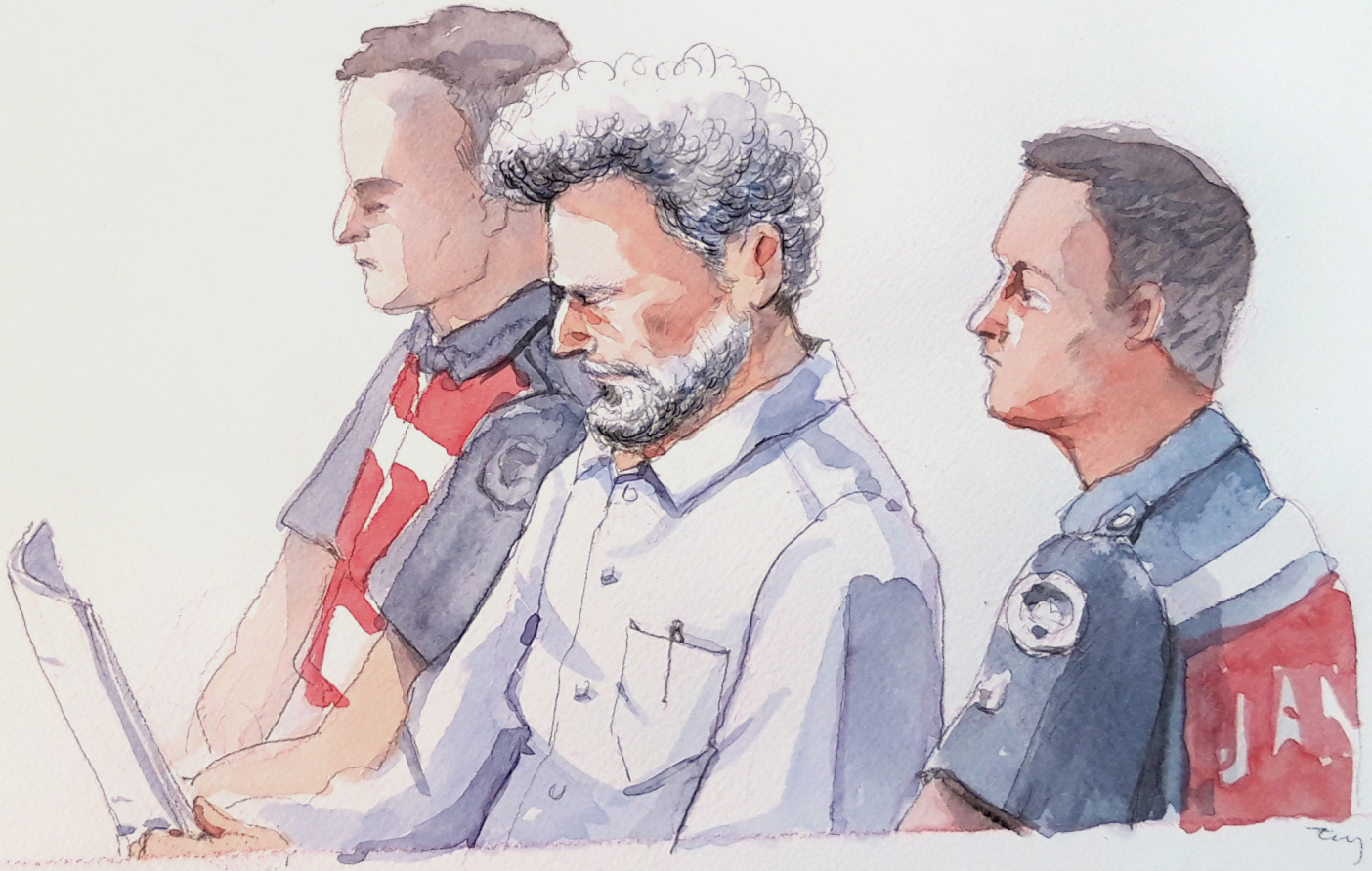
Gezi Davası 18 Temmuz 17 Osman Kavala